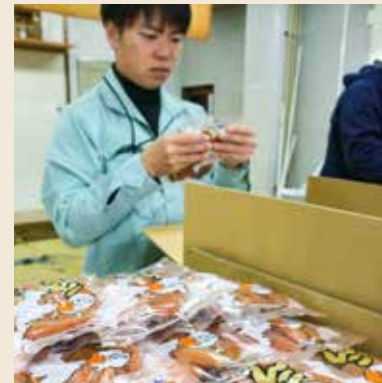
出荷された「きんこ」を検品する担当者