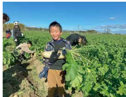
収穫したおでん大根を手に持つ児童