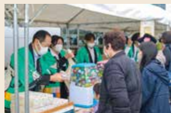
各種相談後、抽選会に参加する来場者ら

3月3日には阿児支店敷地内で「JAフェスタみんなの大相談会in鳥羽志摩」を開催する予定です。