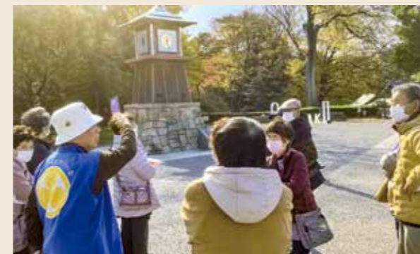
からくり時計の説明を受ける参加者ら

当日は、徳川家康が生まれたとされる岡崎城や、大河ドラマ「どうする家康」の放送に合わせて建設された岡崎大河ドラマ館などを見学した後、松平・徳川將軍家の菩提寺である大樹寺を拝観しました。行程の最後には、まるや八丁味噌の蔵を見学し、帰路につきました。