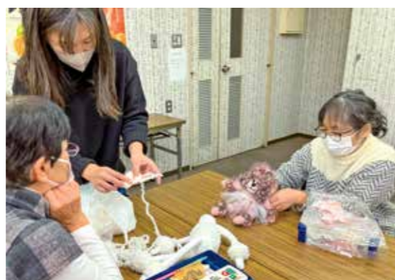
人形を作る参加者ら

台所用のネットや毛糸を使ってパーツを作り飾り付けるなど、一体一体工夫を凝らしています。